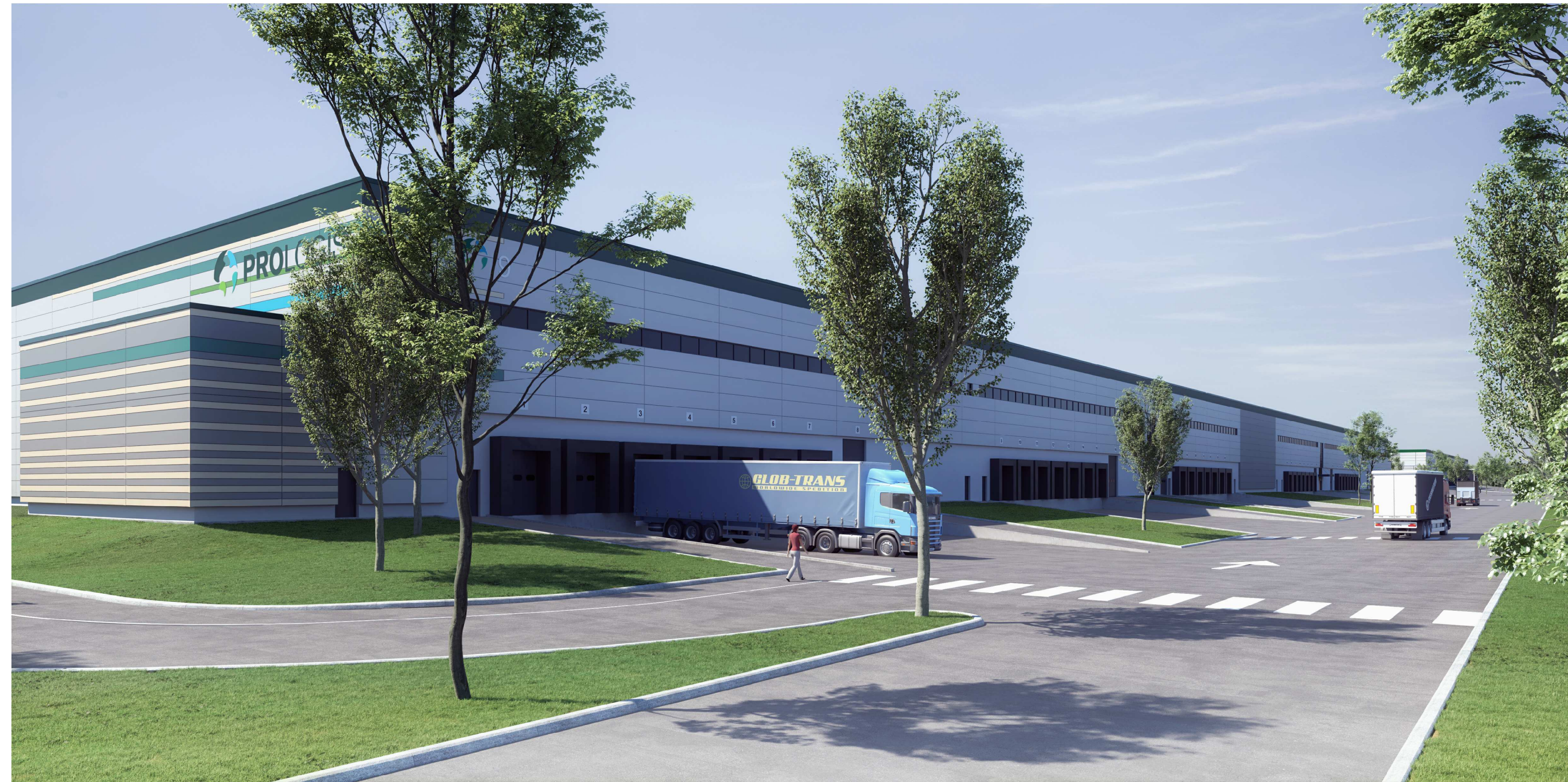
PERSPECTIVE D'INSERTION PC6 (3) SUR BATIMENT 9