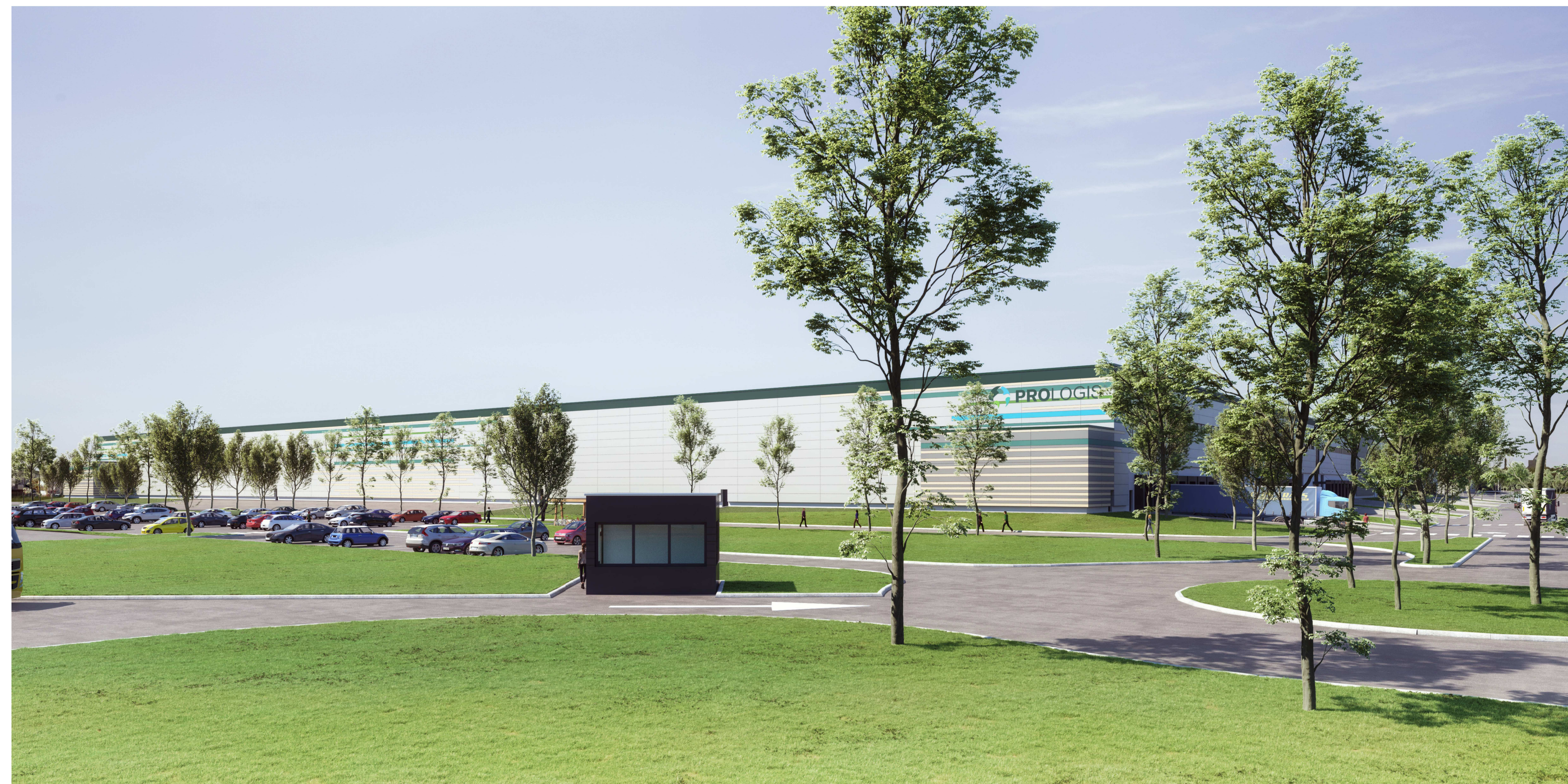
PERSPECTIVE D'INSERTION PC6 (1) DEPUIS L'ENTREE DU SITE